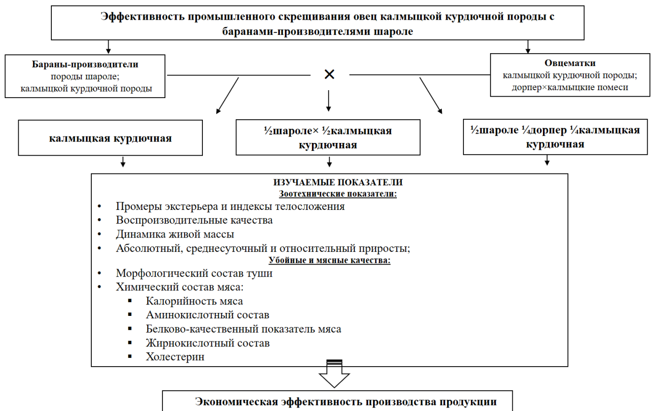
Рисунок 1 – Схема исследований

Материалы исследований обработаны методом вариационной статистики с использованием программы Excel Microsoft Office. Достоверность различий между признаками определяли по Стьюденту при 3-х уровнях вероятности.